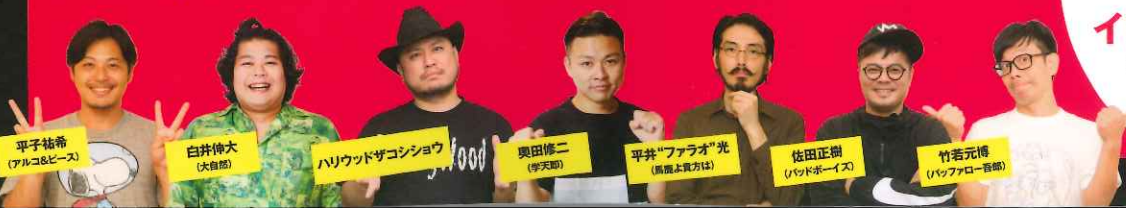
平子祐希 (アルコ&ピース)