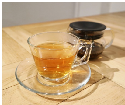
■ ほんのり桜薫る 『さくらティー』 ¥ 590