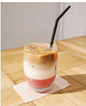
■ いちごの甘みが広がる 『いちごラテ』 ¥ 640