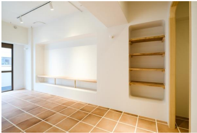
空間をアーティスティックにするディスプレイシェルフ