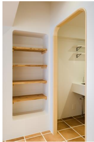
柔らかい雰囲気演出する丸みを帯びたライン