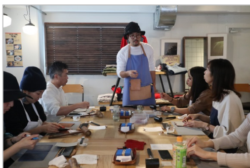
▲過去開催したワークショップの様子

これまでリズムでは、「東京の暮らしをワクワク・ドキドキさせる」ために、“ライフスタイル”“ライフプラン”の両軸から、ワークショップやコミュニティスクールなど、不動産の枠を超えて様々なイベントを開催してきました。リノベーション賃貸ブランド「REISM」を展開するリズムが大きく関わるのは、生活の基盤を作る『暮らし』。実際に東京で一人暮らしをしている若者の『暮らし』について調査の結果、約8割の若者が『住んでいる賃貸住宅内で、他の住民と交流したい』という人は75.1%、特に、“交流したい相手”の58.7%は『趣味が近い住人』ということが判明しています。そこで、オーナー・入居者だけでなく、運営するコミュニティスペース REISM STAND で様々なイベントを開催し、新しいコミュニティを生み出してきた REISM の強みを活かし、都内に住む住民同士の交流の場となる DIY イベントを開催することとなりました。