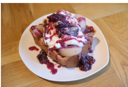
季節のフレーバー(梨とぶどう)味

食パン半斤の中をくり抜いて、一晚卵液にじっくり染み込ませ、しっかりとオープンで焼き上げることで、中はふわふわ、外はカリカリ・サクサクのそれぞれ異なる食感をお楽しみいただけます。大きめに食パンをカットすることで、頬張るたびに感じられる卵のジューシーさと、ふわとろな食感がポイントです。1 番人気のプレーン味は、手作りのホイップクリームをたっぷり使用し、見た目にも美味しくなるように仕上げています。REISM STAND ではホイップクリームやソースも手作りし、季節の旬なフルーツを使用した期間限定のフレーバーもご紹介します。