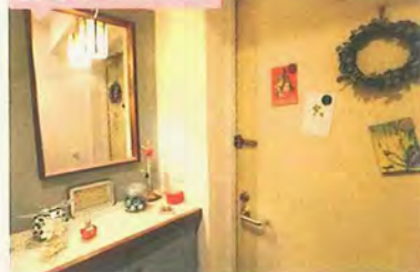
お出掛けお楽しみアイテム！

靴箱の上もタイル貼り。ミニサイズの雑貨を飾って、ドアを開けるのが思わず楽しみになるディスプレイスペース。