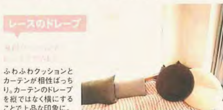
レースのドレープ

30タイプが揃ったキッチン。台所は一番のお気に入り。最低限の設備と使いやすいIHコンロ、そして天板の丸い豆タイルにトキメキます。