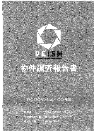
オリジナルの評価レポートを作成

近年、不動産業でもインバウンド需要が拡大している。外国人投資家による売買契約や、日本在住の外国人(東京都新宿区)は7月2日から不動産事業に関する賃貸契約の増加、外国人旅行者による民泊への長期滞在など、不動産会社が外国人と英語でコミュニケーションを取る必要がある場面も増えている。 現在コースを利用している管理会社に対してはレッスンのほか、アメリカ人が入居者に多い物件での部屋の使い方やサービスの説明、トラブルなどに対する対応できる英会話スキルを習得を目指す。 料金は、出張型レッスンが月額20万円から、企業に合わせたオーダーメイドカリキュラム作成は月額25万円から。