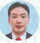
ファイレンセレクト(東京都千代田区)の代表取締役(45)

シェアハウスの企画運営を手がけるファイレンセレクト(東京都千代田区)は3月、神奈川県相模原線「京王稲田堤」駅から徒歩7分の場所に全42戸のシェアハウスをオープンした。