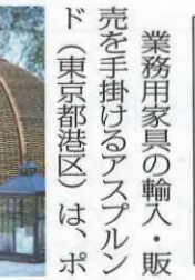
中には椅子やテーブルも置ける

リエチレン製の日よけ『ビッグドームハウス』を提案する。 ポリエチレンとアルミフレームを編み込んだもので、日光が差し込むように工夫されている。耐久性が高く雨ざらしでも問題ない。組み立て式のため移設も容易にできる。 リゾートホテルやウエディング施設、マンション中庭などに設置することで、休憩所としての利用を期待する。