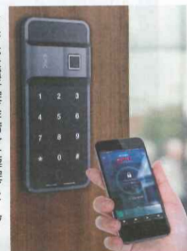
▶スマホを電子錠に近づけた解錠イメージ

エナスピレージョン(静岡県藤枝市)は2月26日、電子錠『E-S-F 300D』の販売を開始した。 スマートフォンを持つ電子錠に近づくと解錠