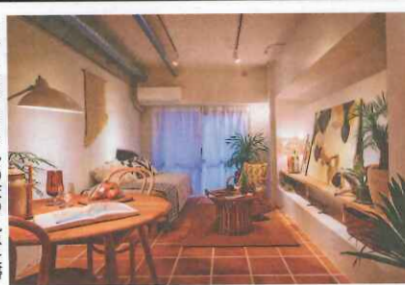
▶テラコッタタイルの床や丸みを帯びたラインが特徴

リノベーション賃貸ブランド『REISM(リズム)』を運営するリズム(東京都渋谷区)は、リノベーション新シリーズ『Boho(ボホ)』の提供を3月より開始した。 『Boho』は、自由奔放なボヘミアンスタイルと、都会的なニューヨークスタイルをミックスしたリノベーションシリーズ。テラコッタタイルの床や、粗野な杉板、丸みを帯びたラインが特徴。壁面のディスプレイの置スペース、カーテン付きのオープンラックなど、収納も用意されている。 リノベーション賃貸ブランド『REISM』は、モロッコの街並みをイメージしたブルーの壁が特徴的な『Chaouen(シャウエン)』や、小上がりの畳スペースで和の雰囲気を醸し出した『Doma(ドマ)』など、世界各国のライフスタイルをモチーフに展開している。 3月現在、東京