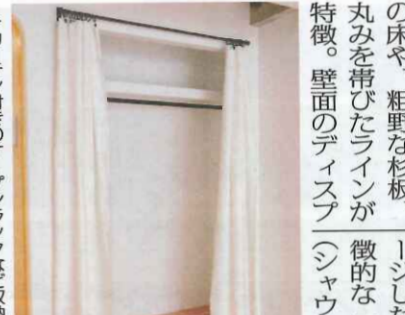
▶カーテン付きのオープンラックなど、収納もスペースも多い

23区でテーマの異なる32個のリノベーションシリーズを展開し、手掛けた空間は542戸を突破している。 担当者は「今後もコン